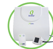
Q-Sense Für einfache kleine Faserprüfungen (QST von 16°C bis 50°C) Test des petites fibres (QST de 16°C à 50°C)

**QST: Quantitative Sensory Testing CPM: Conditioned Pain Modulation