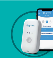
Sooma Schmerztherapie Thérapie de la douleur