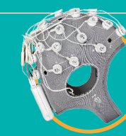
Enobio EEG-Recorder Enregistreur EEG

* mit integriertem EEG-Recorder Avec enregistreur EEG intégré