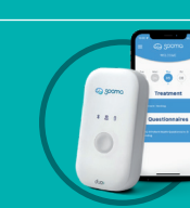
Sooma Depressionstherapie Thérapie de la dépression