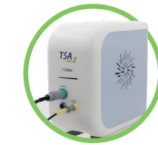
TSA 2 Air NeuroSensory Analyzer (QST*) NeuroSensory Analyzer (QST*)