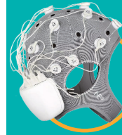
StarStim 20 Wireless 20-kanal tCS-Stimulator* Stimulateur tCS sans-fil 20 canaux*