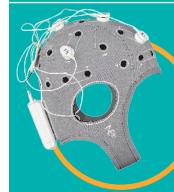
StarStim 8 Wireless 8-kanal tES-Stimulator* Stimulateur tES sans-fil 8 canaux*