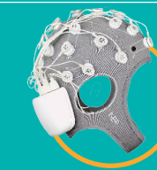
StarStim 32 Wireless 32-kanal tCS-Stimulator* Stimulateur tCS sans-fil 32 canaux*