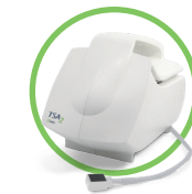
TSA 2 NeuroSensory Analyzer (QST und CPM*) NeuroSensory Analyzer (QST et CPM*)

Les systèmes Medoc sont reconnus dans le monde entier comme le gold-standard pour l'évaluation des voies sensorielles (douleur et chaleur). Le champ d'application est large et va du diagnostic (neuropathie des petites fibres, fibromyalgie, algodystrophie, lésions médullaires, radiculopathies...), à la recherche en passant par le suivi d'études pharmacologiques.